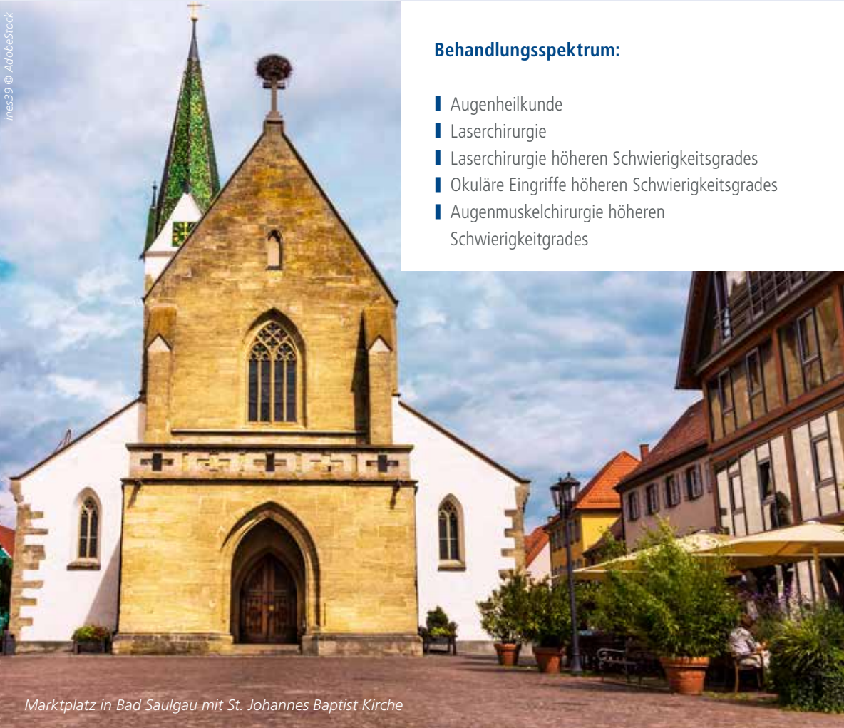
Marktplatz in Bad Saulgau mit St. Johannes Baptist Kirche